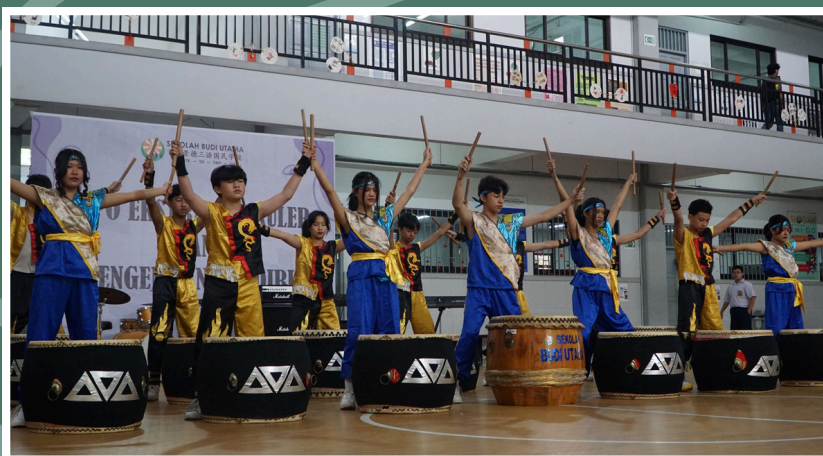
(19/7) Penampilan Chinese Drum di Eskul Expo di SMP Budi Utama