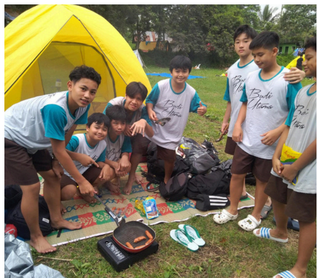
(Siswa-siswi SMP Budi Utama memasak)

“Saya berharap agar para teman-teman kelas VII dan VIII SMP Budi Utama dapat mempelajari sikap sempurna saat pramuka, menambah ilmu tentang kepramukaan, meningkatkan sikap budi utama, dan menjadi lebih bertanggungjawab. Kesan saya selama mengikuti kegiatan perkemahan lelah namun senang,” ungkap salah satu siswa kelas VIII SMP Budi Utama.