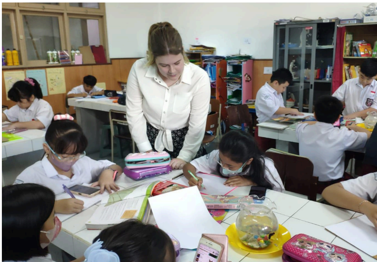
(Barisan siswa-siswi SMP Budi Utama)