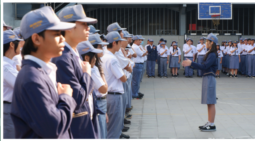
(15/7) Upacara bendera SMA Budi Utama, hari pertama kembali masuk sekolah.