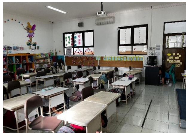
(Siswa berlindung di bawah meja)

Sebelumnya, siswa dan siswi melaksanakan kegiatan di kelas seperti biasa. Kemudian kegiatan simulasi dimulai, ditandai dengan dibunyikannya sirene sebagai tanda adanya gempa bumi. Wali kelas pun bertugas untuk menginstruksikan seluruh siswa-siswi berlindung di bawah meja hingga sirene berhenti yang menandakan bahwa gempa telah berhenti.