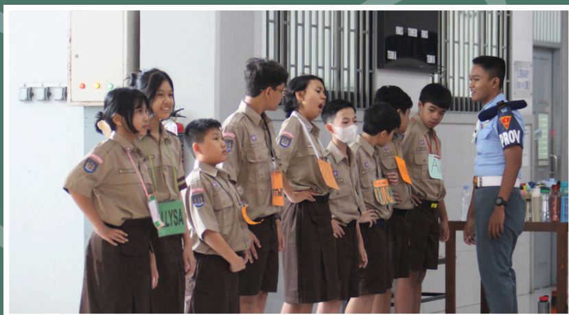
(15/7) Upacara bendera SMA Budi Utama, hari pertama kembali masuk sekolah.