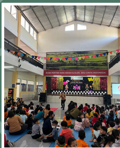
(19/7) Keseruan kegiatan MPLS dan Bazar SD Budi Utama.