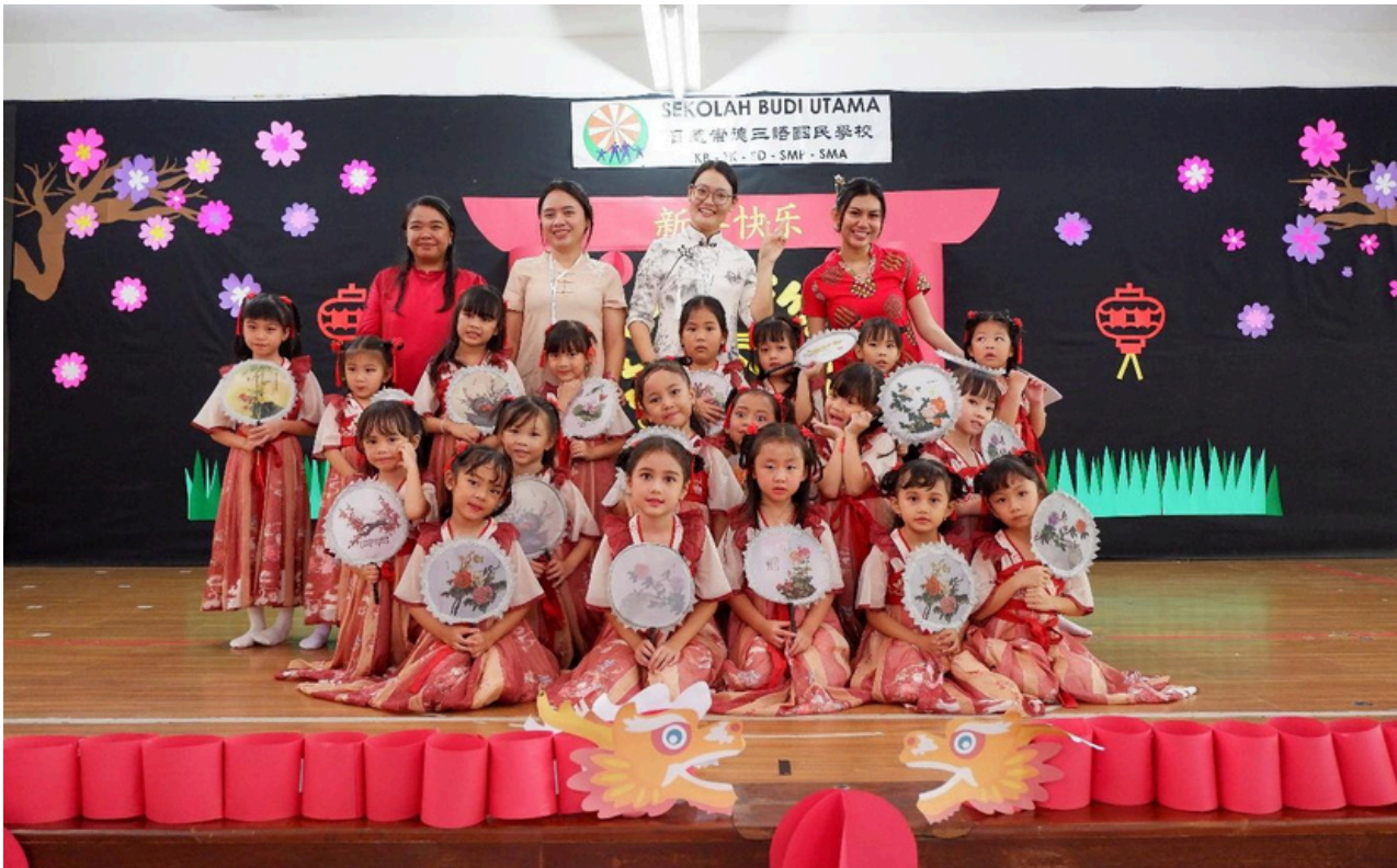
(Barisan siswa-siswi SMP Budi Utama)