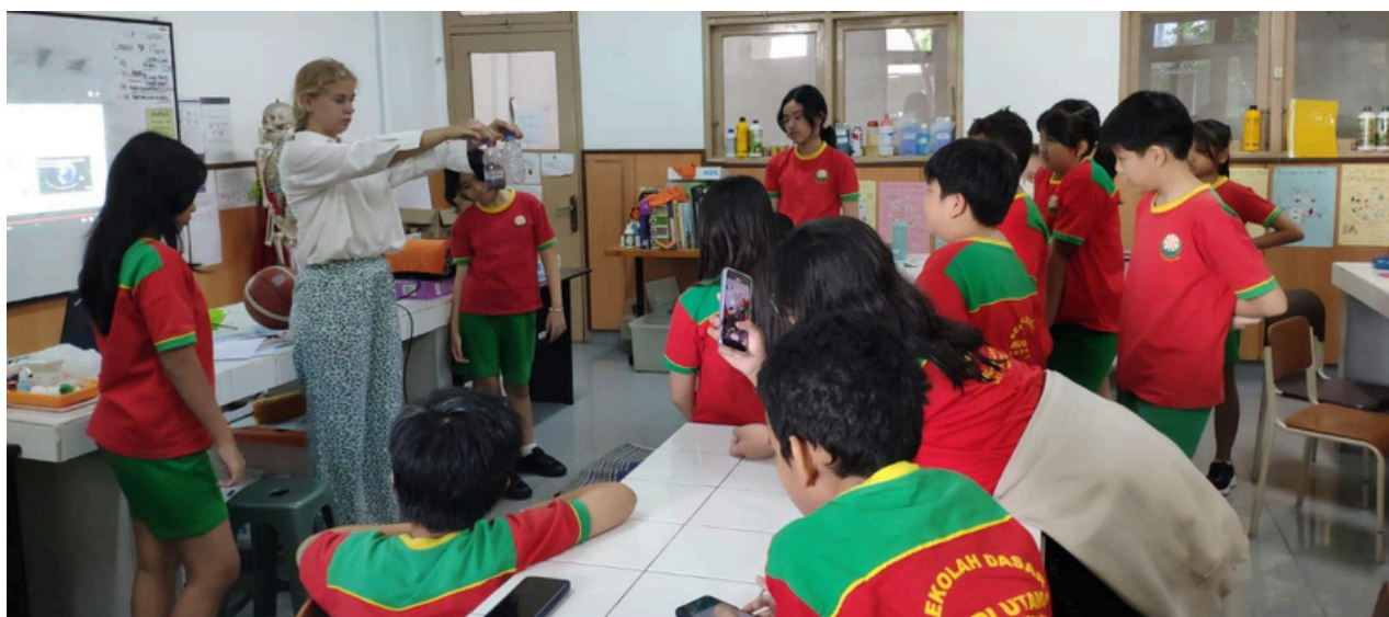
(Barisan siswa-siswi SMP Budi Utama)