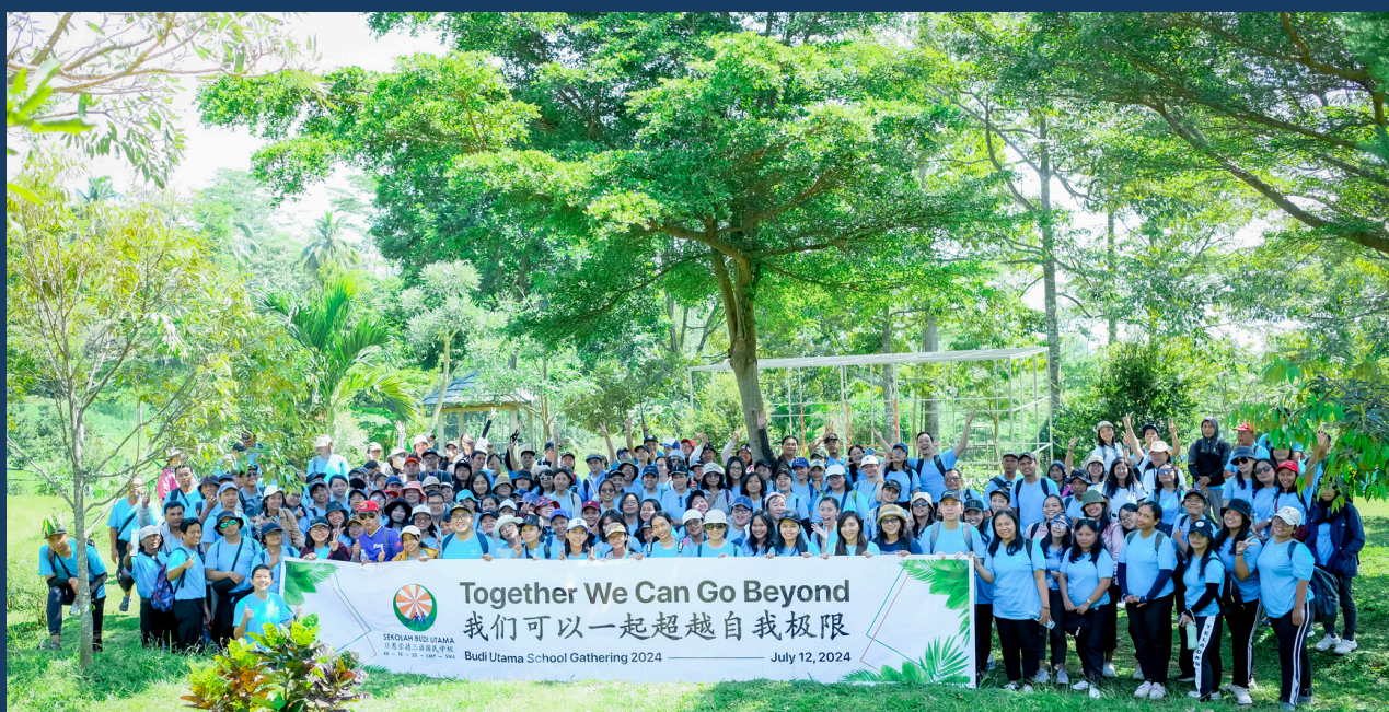
(12/7) Budi Utama School teacher and staff.

On July 12, The teachers and staff of Budi Utama School came together for a fun day at Boemisora, Semarang.