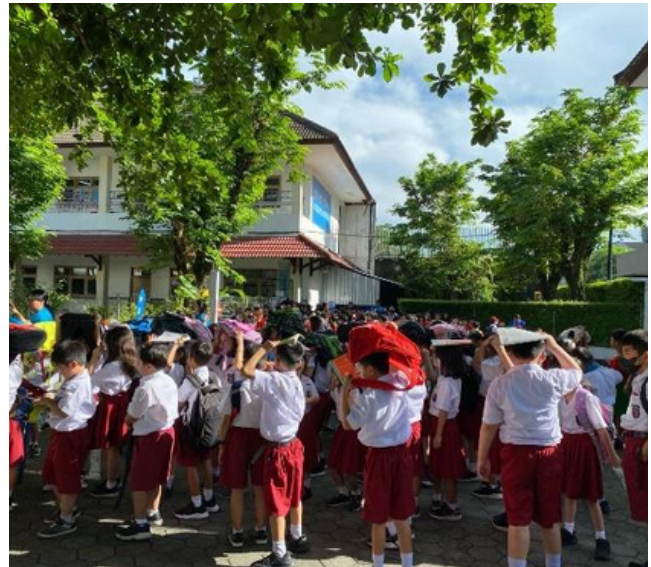
(Siswa berkumpul di titik kumpul)