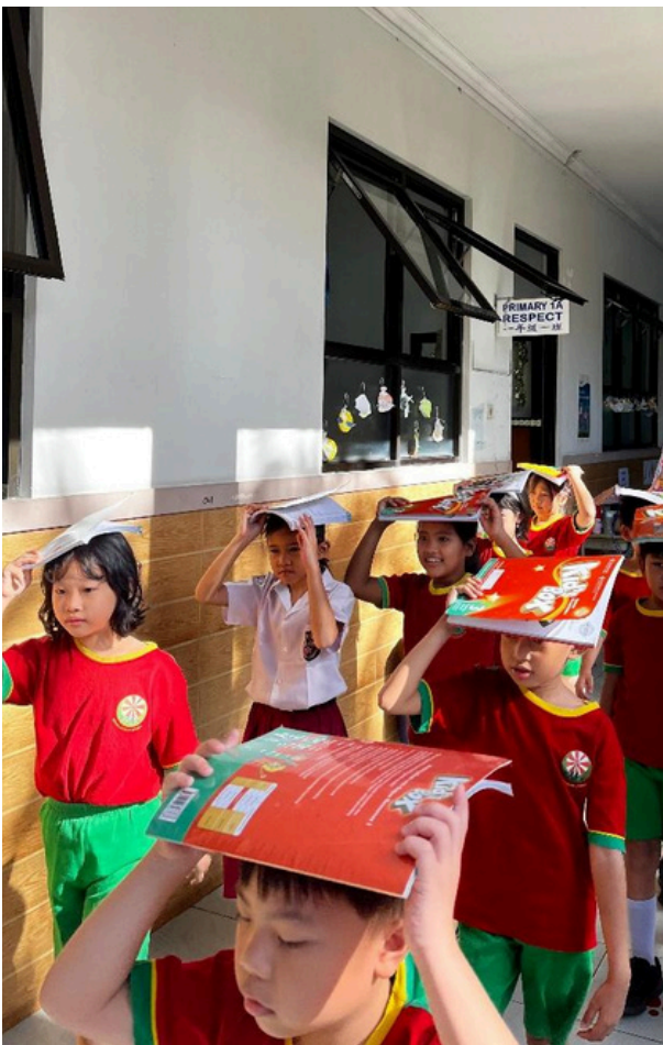
(Melindungi kepala saat proses evakuasi)

Titik kumpul berada di tempat terbuka di halaman sekolah. Begitu sampai di titik kumpul, guru menginstruksikan para siswa untuk tetap tenang dan memeriksa kelengkapan teman di sebelah kanan dan kirinya sembari menunggu informasi yang menyatakan bahwa situasi sudah aman. Demikian, setelah dinyatakan aman dalam simulasi ini, siswa diarahkan untuk kembali berbaris menuju kelas masing-masing.