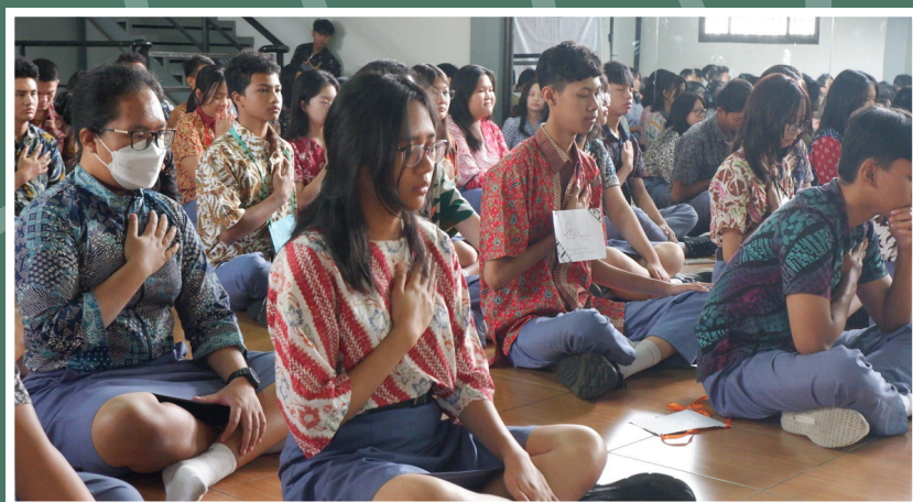
(19/7) Penampilan Chinese Drum di Eskul Expo di SMP Budi Utama