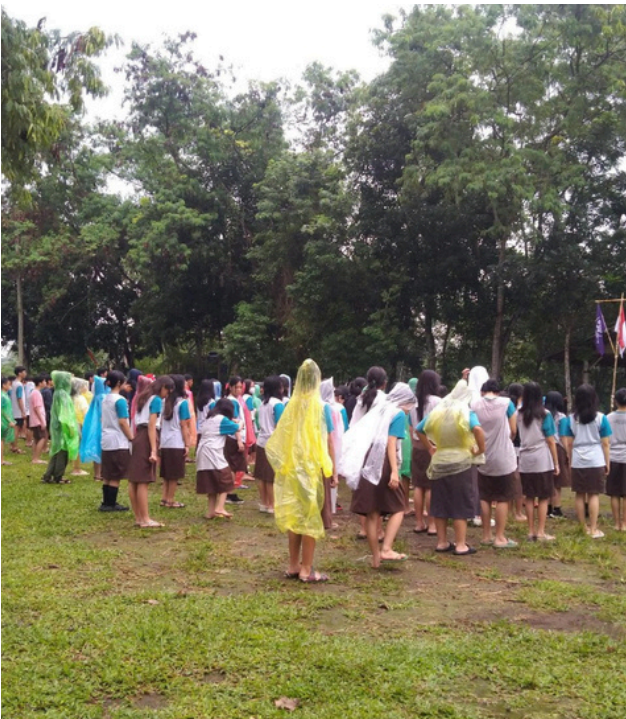
(Barisan siswa-siswi SMP Budi Utama)