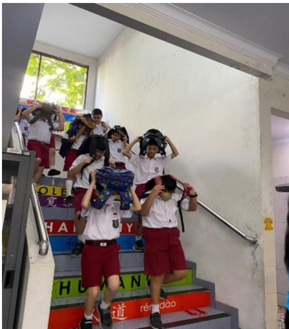
(Evakuasi menuju titik kumpul)

Dalam rangka mengedukasi warga sekolah mengenai langkah-langkah yang harus dilakukan saat terjadi gempa bumi, SD Budi Utama (18/3) melaksanakan simulasi penanggulangan bencana gempa bumi diikuti oleh seluruh warga sekolah. Kegiatan simulasi bencana ini merupakan agenda rutin tahunan yang dilaksanakan di SD Budi Utama agar seluruh warga sekolah dapat mengantisipasi kebingungan apabila nantinya terdapat bencana gempa bumi yang tidak dapat diprediksi.