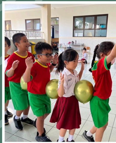
(19/7) Keseruan kegiatan MPLS dan Bazar SD Budi Utama.