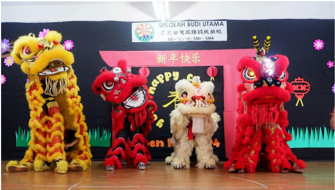
(Barisan siswa-siswi SMP Budi Utama)